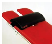
SP1 Nack Kudd