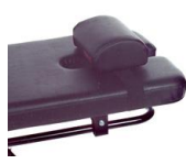
SP3 Nack Kudd, extra hög

Färger SP1: Röd, Svart Färger SP2 och SP3: Svart